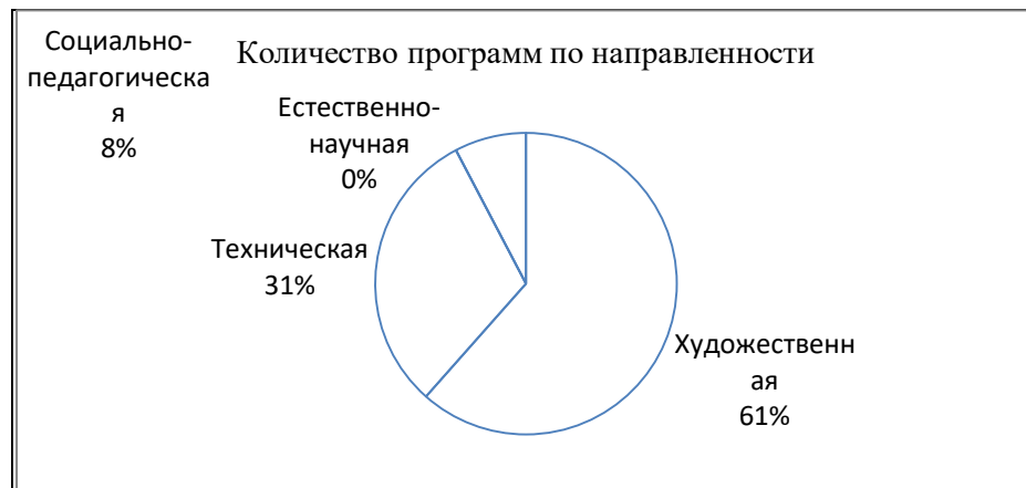
Рисунок 1- Количество программ по направленности

На диаграмме видно, что наиболее востребованными являются программы художественной направленности. Подобная ситуация напрямую связана с половозрастными особенностями контингента обучающихся и педагогов, повышением интереса социума к различным видам декоративно-прикладного творчества.