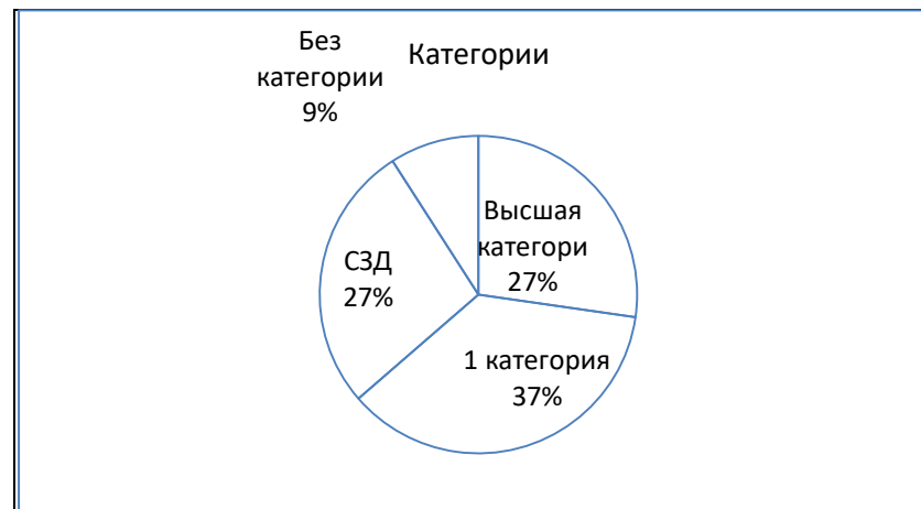
Рисунок 2 – Распределение педагогических работников по категориям